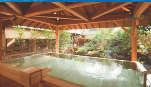
写真はすべてイメージです。

下部ホテル 戦国武将、武田信玄公ゆかりの下部温泉郷は二千年の歴史を刻む、隠し湯の里。