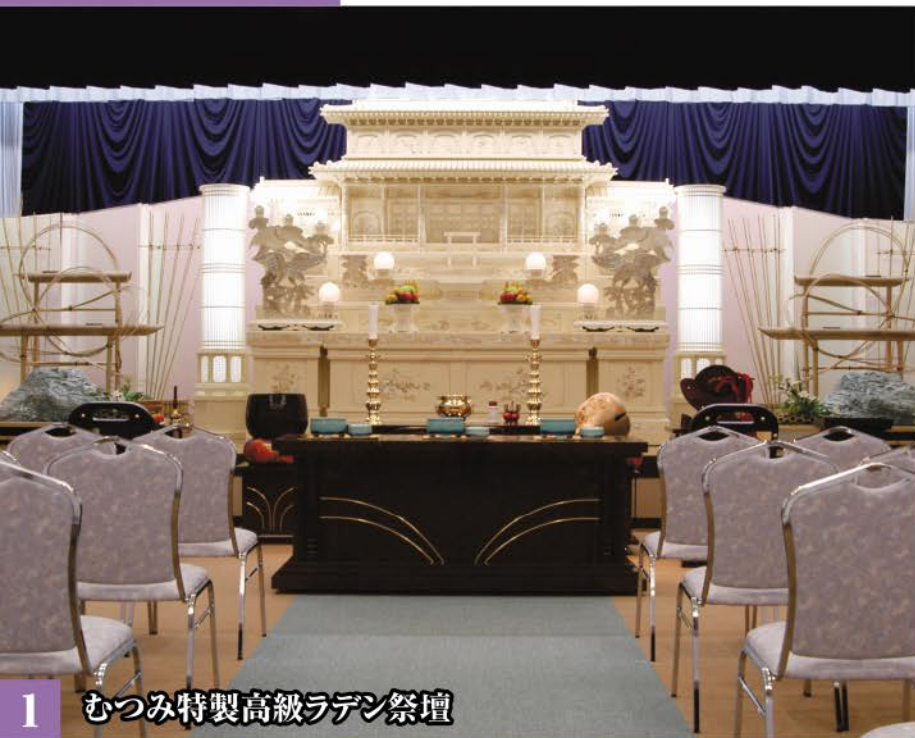
1 むつみ特製高級ラデン祭壇

ホール最大収容人数/126名(着席状態) 会食室(洋室)最大収容人数/90名(着席状態) ご遺族控室(和室)完備 駐車場/130台