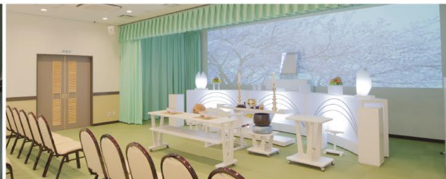
2 式場内(会食パターン)