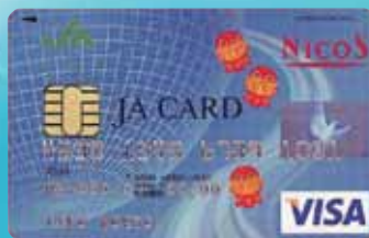
JAカード (ちょんぎょ)