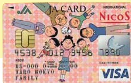
■JAカード(一体型)サザエさん 家族会員カード