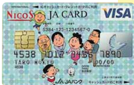
■JAカード(一体型)サザエさん 本人会員カード